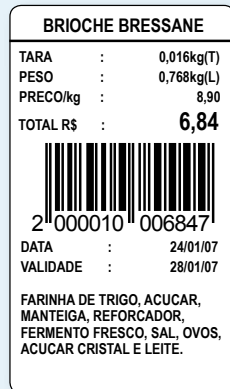
30 mm (L) x 50 mm (A)

Informações básicas da transação e campo para receita/ingredientes