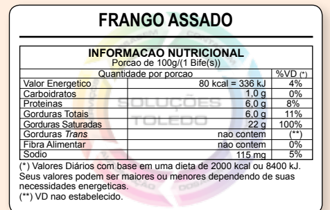
60 mm (L) x 40 mm (A)