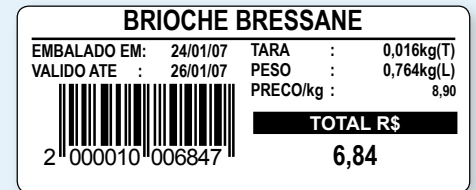
60 mm (L) x 25 mm (A)

Etiquetas com largura de 30 mm, 40 mm e/ou 60 mm. Flexibilida de escolha com baixo custo.