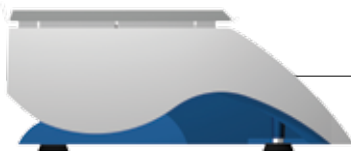
Vista Lateral Direita