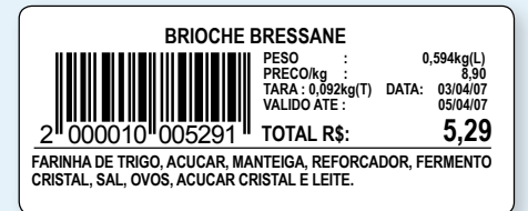
60 mm (L) x 25 mm (A)