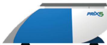
Vista Lateral Esquerda