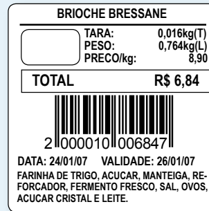
40 mm (L) x 40 mm (A)