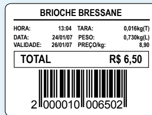
40 mm (L) x 30 mm (A)