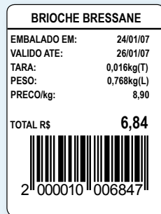
30 mm (L) x 40 mm (A)